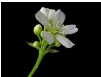
捕蠅草的花在夏天盛開

然而，於原產地的捕蠅草在生存上卻受到人類活動的威脅。人口快速增加因而剝奪捕蠅草的生存空間，而且由於人為干預自然野火的發生，使得這些地區開始長出一些小型灌木，因而遮蔽捕蠅草的陽光。因此，捕蠅草被試著引入其他地區進行復育，像是美國的新澤西州和加州。在美國佛羅里達州已順利歸化，而成為很大的族群。