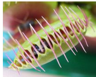
極快速度將牠夾住