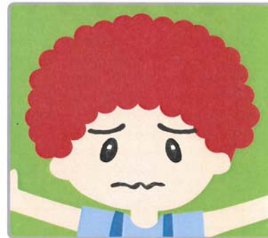
第四十二課 戰兢／恐慌