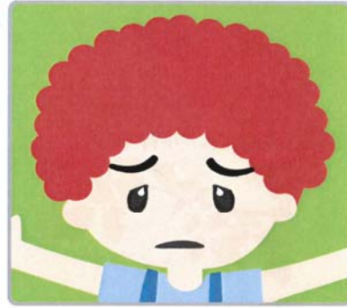
第四十課 內疚／自責