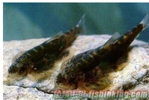
華吸鰻 (琵琶清道夫)