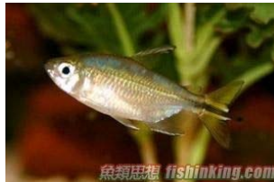
剛果扯旗 (別名：剛果魚)