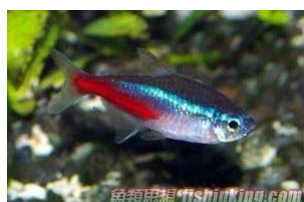
紅綠燈 (別名：霓虹燈)