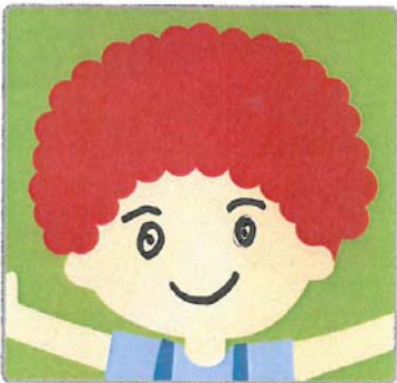
第三、四課 平安、友善